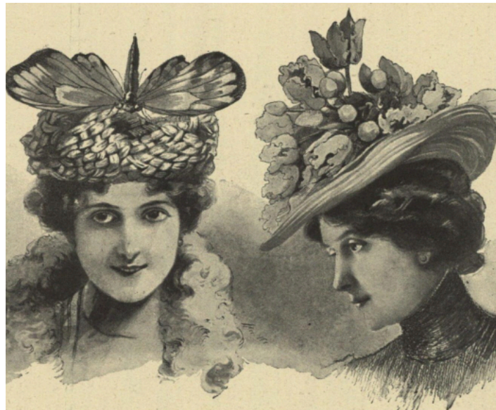
Klobouk (toque) ze zelené slámy libelou zdobený a klobouk ze slámy a hedvábného mušelínu, vystavuje firma Cajlier, Paříž

Kamkoliv oko lidské pohlédne, všude shledává se s krásnými paními a ještě s krásnějšími toilettami. Letos ovládá nejvíce barva krémová, žlutá, bezleskle modrá, vesměs ale jen ve světlých odstínech. Rovněž při jinobarevných látkách dává se přednost jen světlým odstínům. Až dosud zřít bylo sukně nahoře těsně přiléhající, dole velmi rozšířená, takže tvořily kornoutovité záhyby a malé vlečky krajkou, stuhami neb volanty ohraničené.